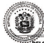
DELCY ELOÍNA RODRÍGUEZ GÓMEZ Vicepresidenta Ejecutiva