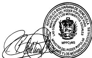
BLANCA ROSA EEKHOUT GÓMEZ

Ministra del Poder Popular para las Comunas y los Movimientos Sociales Decreto N° 3.604 de fecha 04 de septiembre de 2018, publicado en la Gaceta Oficial de la República Bolivariana de Venezuela N° 41.474, de fecha 04 de septiembre de 2018, reimpreso por fallas en los originales en la Gaceta Oficial de la República Bolivariana de Venezuela N° 41.479 de fecha 11 de septiembre de 2018