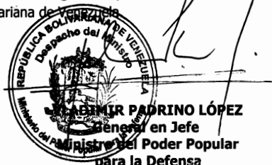
ABIMIR PADRINO LÓPEZ General en Jefe Ministerio del Poder Popular para la Defensa

Comuníquese y publíquese. Por el Ejecutivo Nacional,