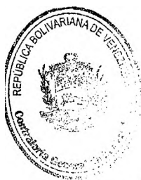
MANUEL E. GALINDO B. Contralor General de la República